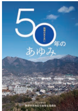
「創立50周年記念誌50年のあゆみ」

平成30年6月3日に、西地区社協の創立50周年記念式典が開催されました。創立50周年記念誌「50年のあゆみ」は、