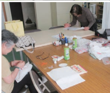
ちょっとした打ち合わせや作業が行えるスペース