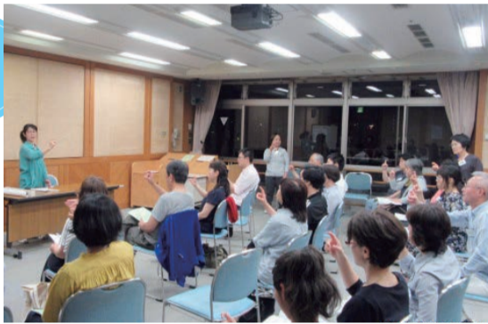
手話ボランティア講座の様子