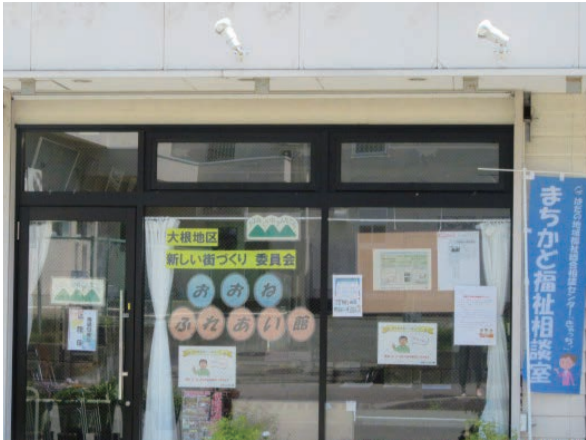
「おおねふれあい館」外観