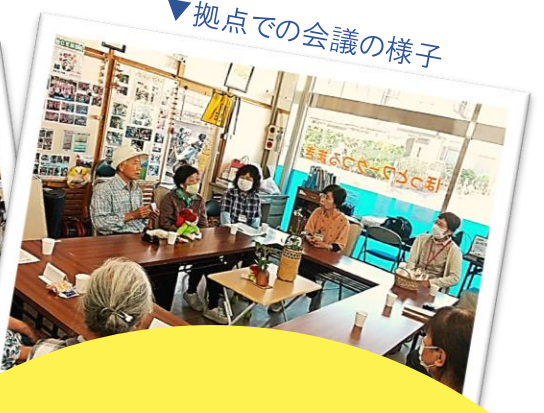
▼拠点での会議の様子