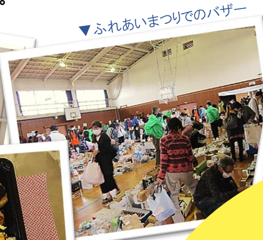
▼ふれあいまつりでのバザー