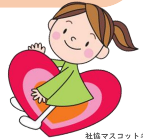
社協マスコットキャラクター ハートフルちゃん

秦野市内の各地区社協は、それぞれに福祉目標を定めて活動しています。 あなたのまちの地区社協は、どんな目標を掲げているでしょうか？